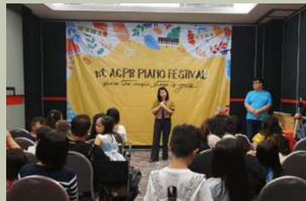
Meet the Jury